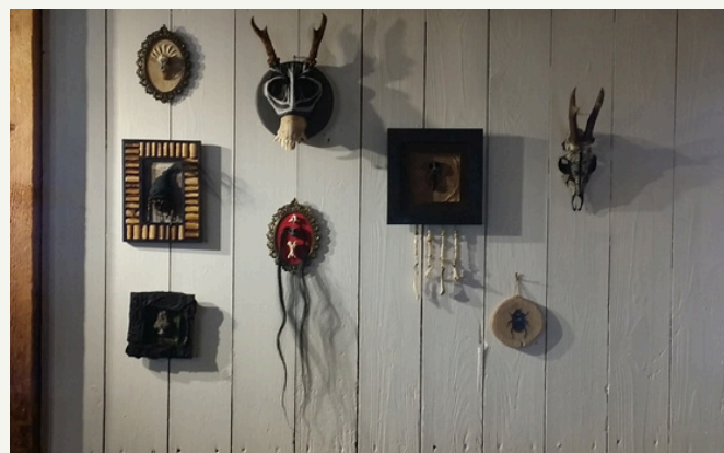
vägg bredvid fönster på vänster om ko-basen 4