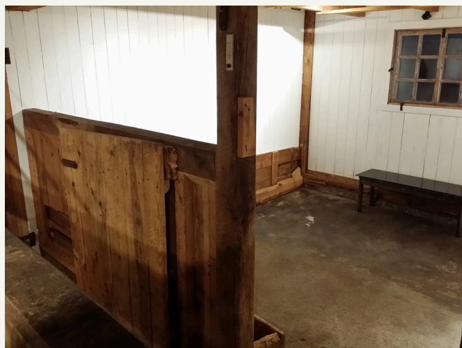
box (till höger)