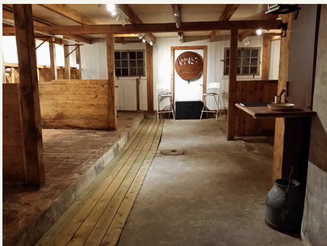
rakt in ifrån ingången