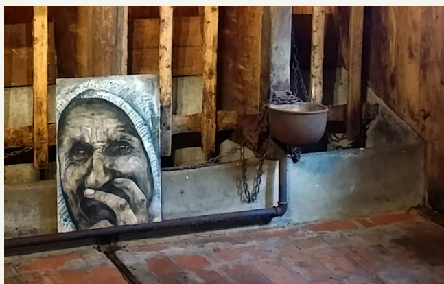
detalj i ko-basen 3