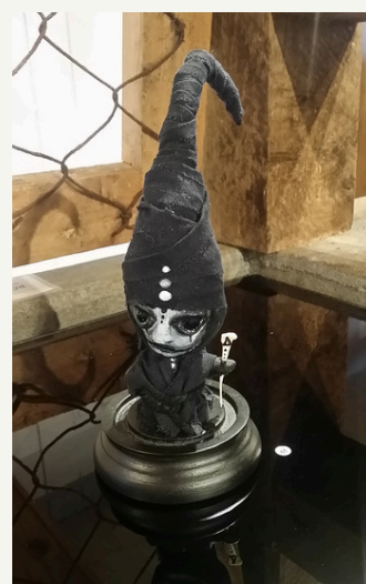
skulptur på svart glas på krubb