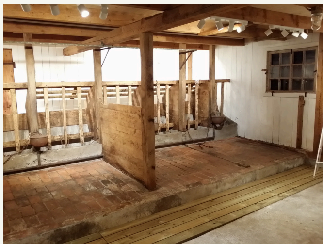
ko-basen 2 och 3