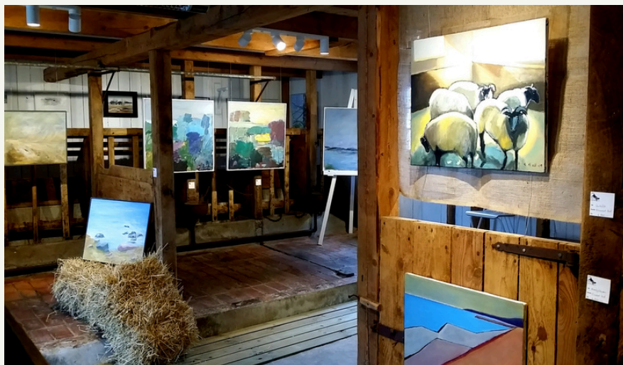
ko-basen 2 & 3, höger: dörr/vägg mellan ko-basen 4 & 5