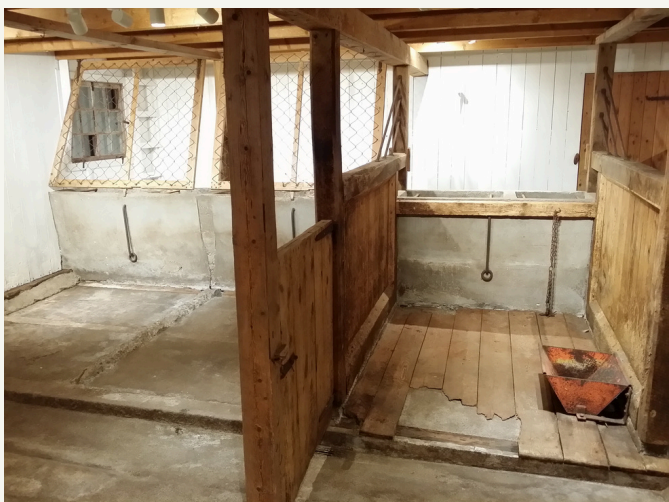
ko-basen 4 och 5