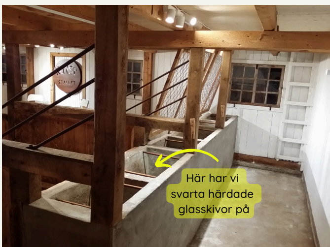
bakom ko-basen 4 och 5 - vägg 3