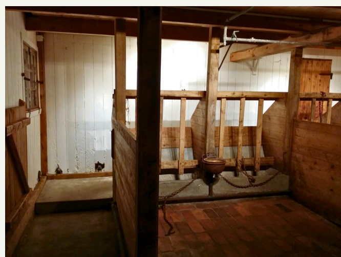
vägg 1 och ko-basen 1